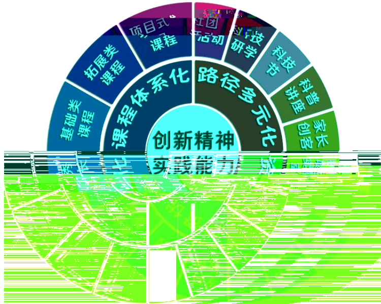
1 “ ”